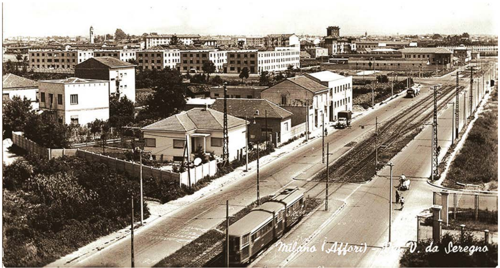
Affori - via Vincenzo da Seregno.