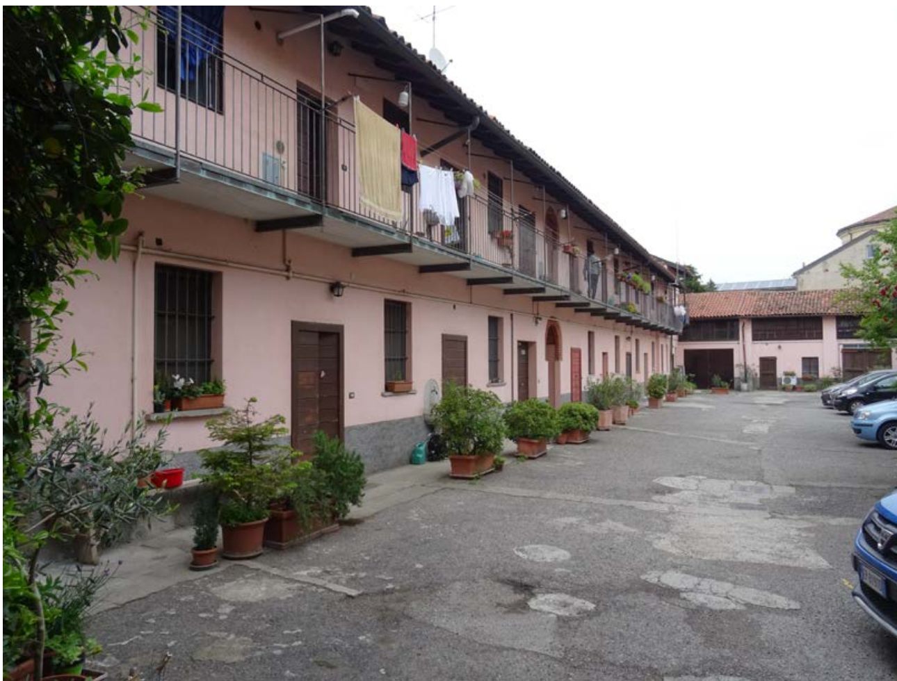
Una vecchia cascina ad Affori, foto 2022