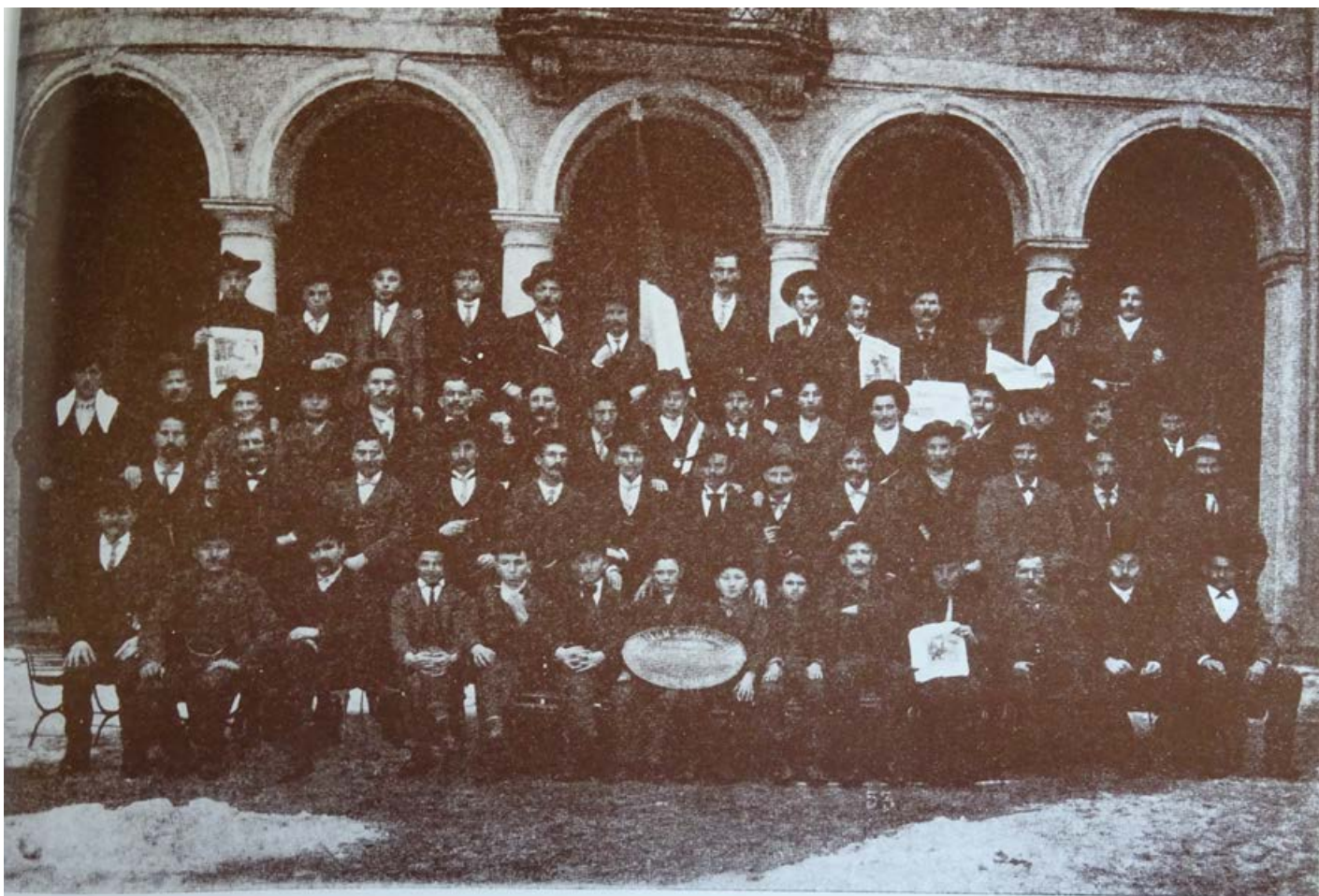
Sezione di AFFORI (Milano).

Società Lavoranti Muratori Sezione di Affori 1888 - 72 soci