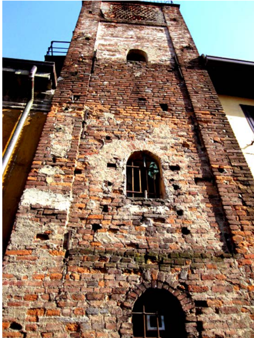
Affori - Torre di guardia - via Osculati sec XIV (è possibile la stampa in b/n?).