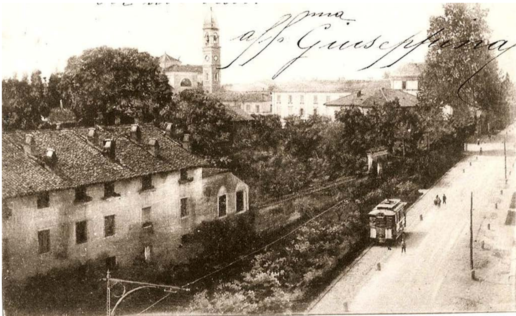
Affori - Cassina Ferrarezza e Parco Osculati - inizi '900. Fonte: archivio digitale Luigi Ripamonti