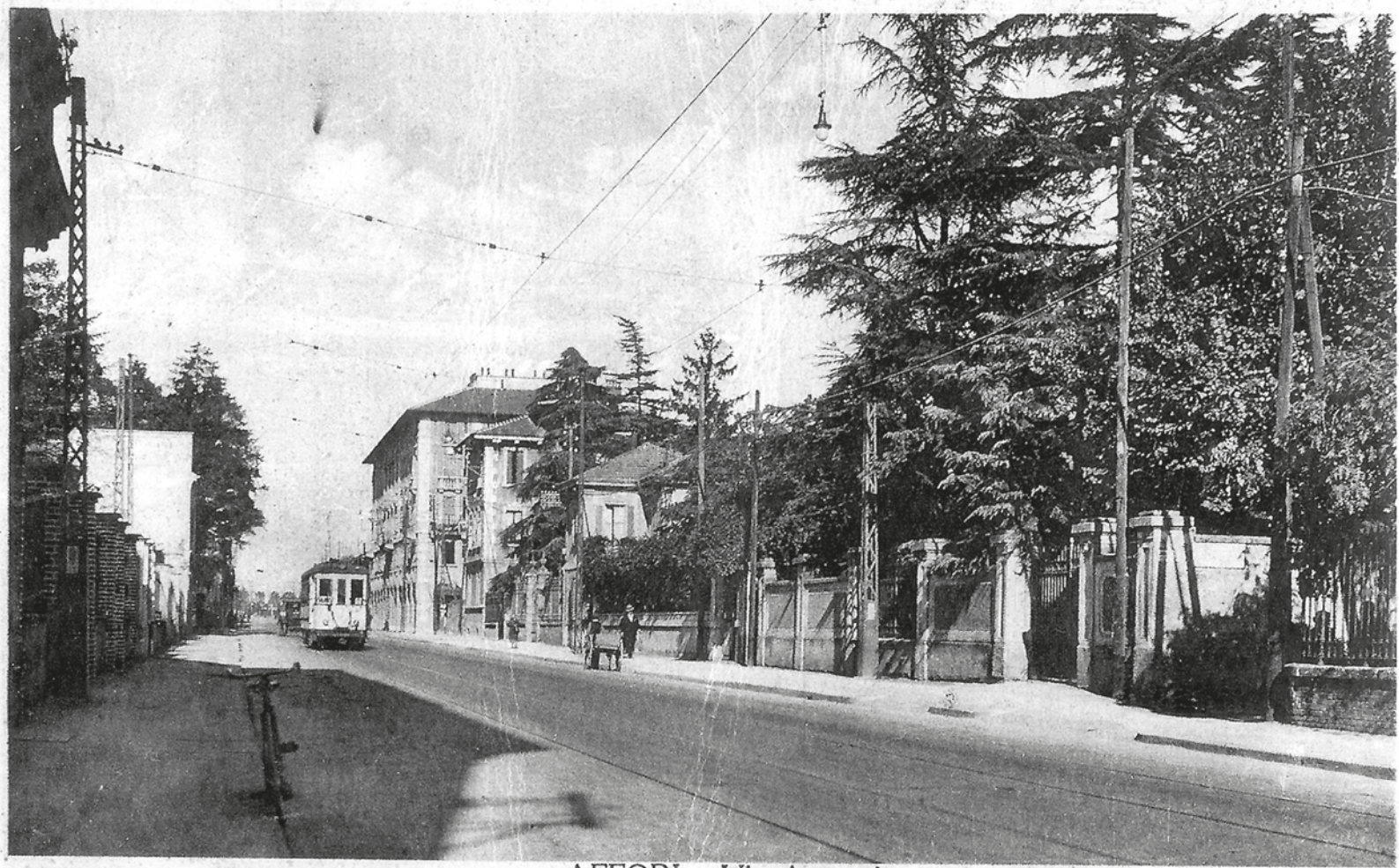
AFFORI - Via Astesani