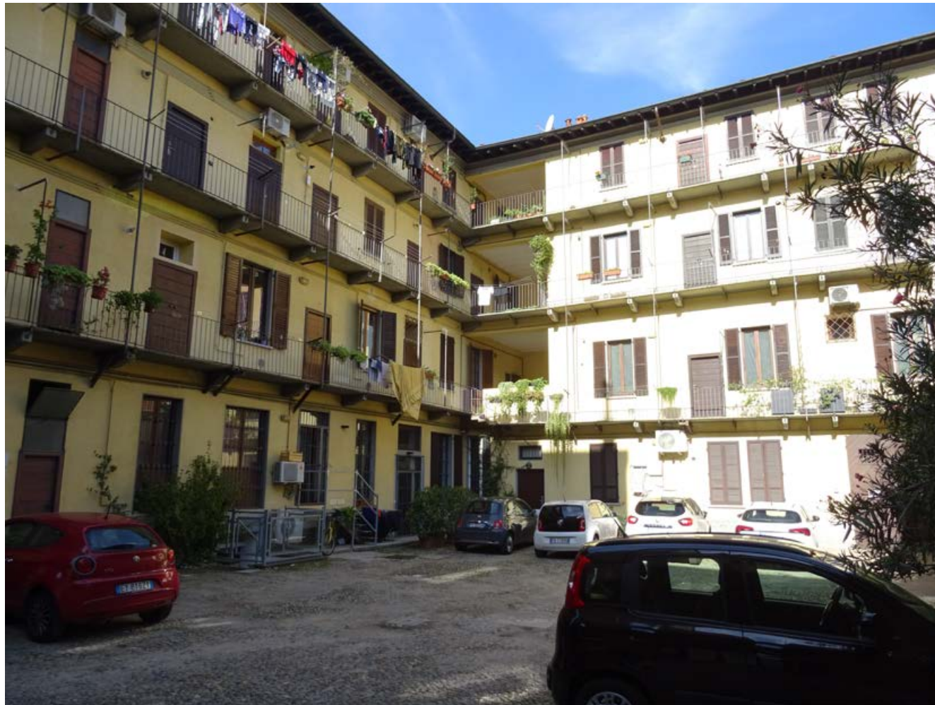
Una "casa di ringhiera" ad Affori, foto 2022